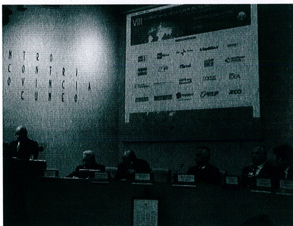
Un'immagine dell'edizione 2010 di Greenaccord a Cuneo

La conferenza di presentazione dell'evento sarà mercoledì 13 aprile in Prefettura. Il forum si svolgerà ad ottobre 2011, con tantissimi ospiti da tutto il mondo